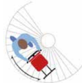
Scala chiocciola Spiral staircase