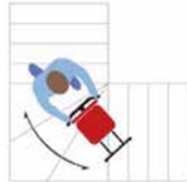
Scala trapezoidale Trapezoidal staircase